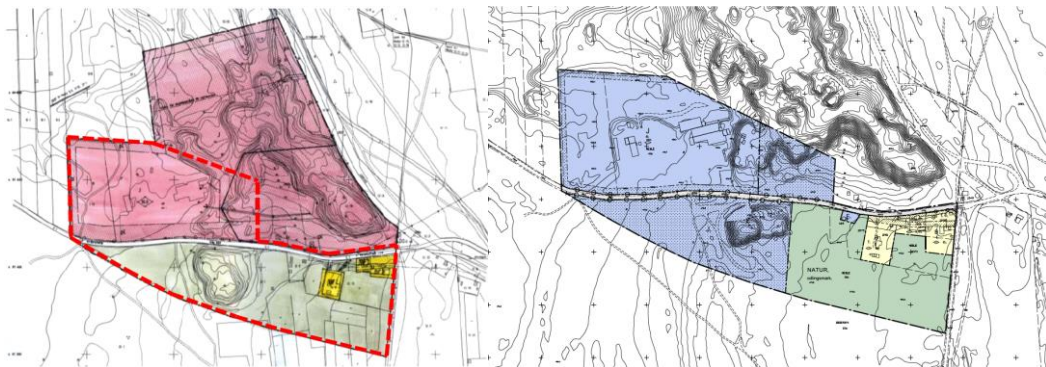
Figur 1. Till vänster, utdrag från planbeskrivning med karta över gällande detaljplan (byggnadsplan från 1984) med aktuellt planområde ungefärligt markerad med röstreckad linje. Till höger, utdrag ur plankarta tillhörande den detaljplan som nu är föremål för domstolens prövning.

Syftet med detaljplanen är enligt planbeskrivningen att möjliggöra för ytterligare upplagsytor av ballastmaterial samt utöka byggrätten för två befintliga fastigheter inom planområdets östra del, se figur 1.