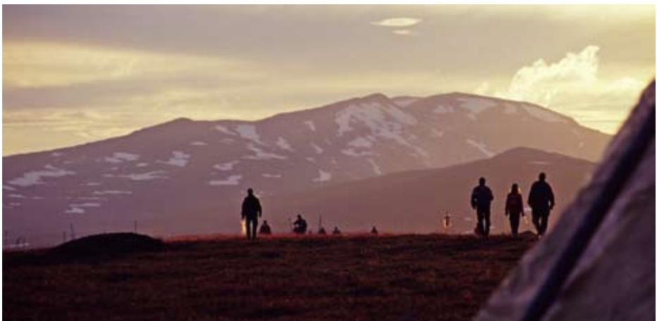
Kalvmärkning i Julimånad.

Det finns visserligen kvinnliga husbönder men för det mesta är det männen som har mest renar, flest röster och därmed störst makt i samebyarna. Visserligen har varje sameby möjlighet att göra självständiga tolkningar av lagen. Men många samebyar håller sig fortfarande till lagstadgad och etablerad praxis, när det gäller samebyns interna beslutsprocesser.